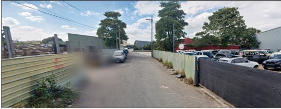
榮興段現況 (違規非農用)