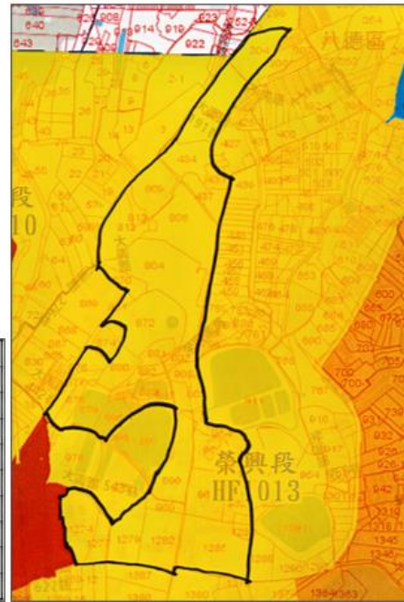
榮興段使用分區圖